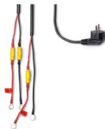
Medföljande kablage 10A