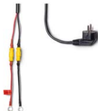
Medföljande kablage 6A

*För kompletta specifikationer och manualer besök www.mastervolt.se